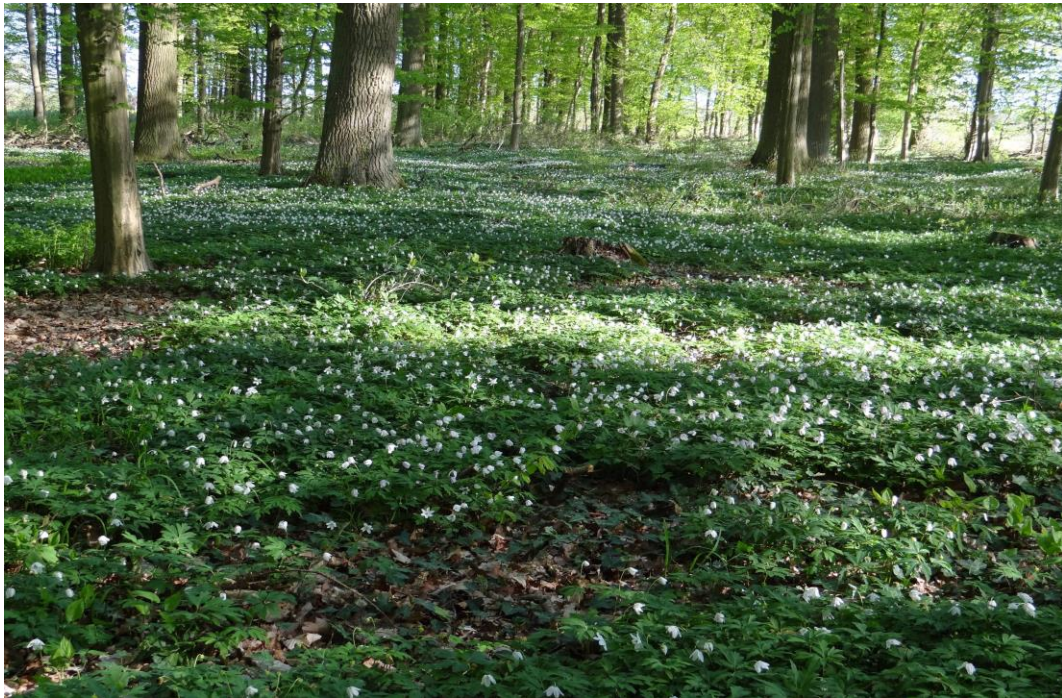
Alte Buchenwälder im Nationalpark Kellerwald-Frühlingsaspekt, Foto: von Voithenberg