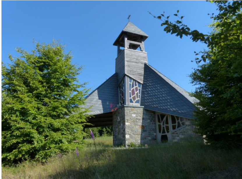
Querst-Kapelle im Nationalpark Kellerwald